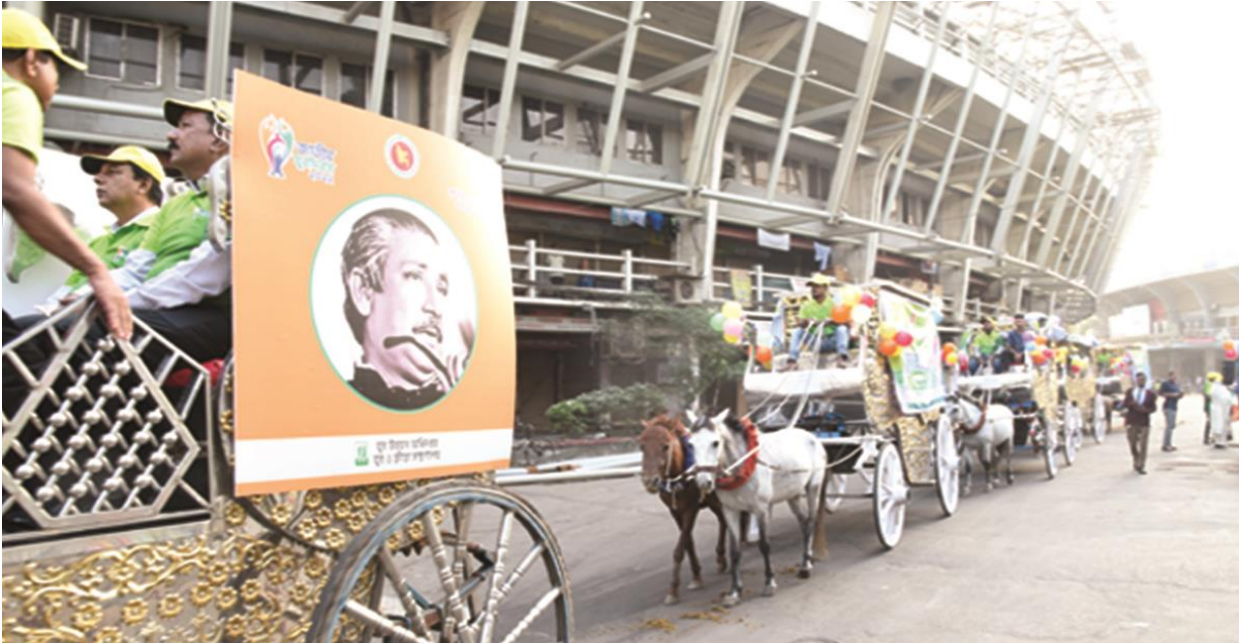
জাতীয় যুবদিবস ২০২২ উপলক্ষ্যে বর্ণাঢ্য যুব র্যালি