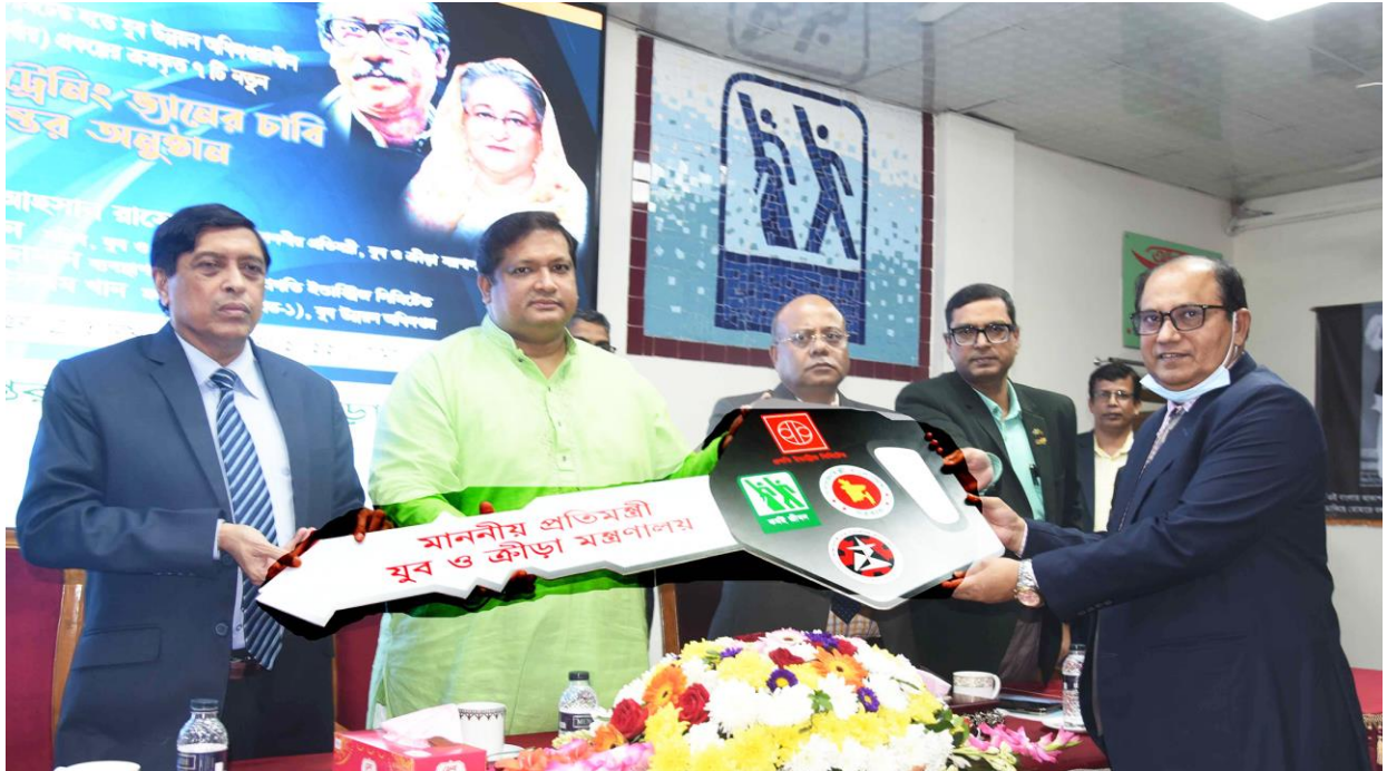
যুব উন্নয়ন অধিদপ্তরায়ীন টেকাব প্রকল্পের ( ২য় পর্ব ) ৭ টি নতুন আইসিটি ট্রেনিং ভ্যানের চাবি হস্তান্তর অনুষ্ঠানে মাননীয়