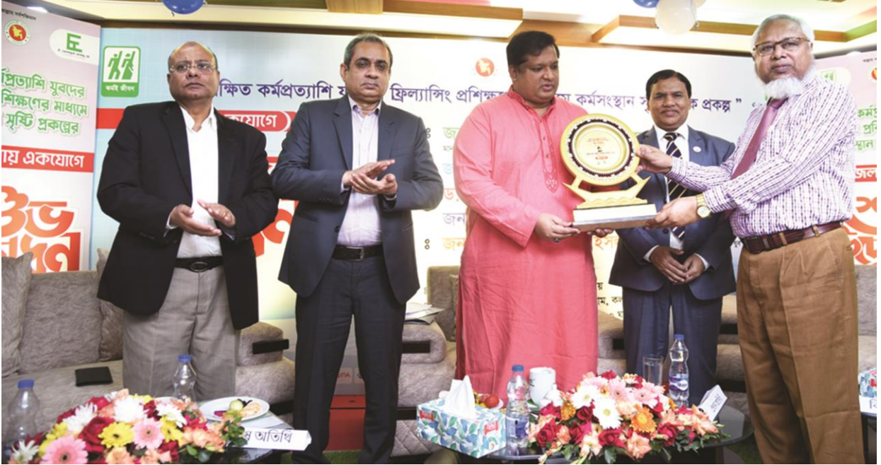
শিক্ষিত কর্মপ্রত্যাশী যুবদেও ফিল্যান্সিং প্রশিক্ষণের মাধ্যমে কর্মসংস্থান সৃষ্টি শীর্ষক প্রকল্পের উদ্বোধনী অনুষ্ঠানে প্রধান অতিথি মাননীয় যুব ও ক্রীড়া প্রতিমন্ত্রী জনাব মোঃ জাহিদ আহসান রাসেল এমপি কে ফ্রেস্ট প্রদান

০৮। ILO Bangladesh এর সহযোগিতায় যুব উন্নয়ন অধিদপ্তর কর্তৃক বাস্তবায়িত "Improving Skills & Economic Opportunities of Women Youth in Cox's Bazar District" প্রকল্পটি কক্সবাজার জেলা এবং উপজেলা পর্যায়ে ১৮ থেকে ৩৫ বছর বয়সের যুবদের নিয়ে অধিদপ্তরের বিদ্যমান প্রাতিষ্ঠানিক এবং অপ্রাতিষ্ঠানিক প্রশিক্ষণ ট্রেডসমূহে প্রশিক্ষণ উপকরণসহ অন্যান্য কর্মকাণ্ডে সহযোগিতা প্রদান করবে। প্রত্যন্ত এলাকার যুব মহিলাদেরকে অগ্রাধিকার ভিত্তিতে বিভিন্ন প্রশিক্ষণে অংশগ্রহণ করার সুযোগ সৃষ্টির মাধ্যমে তাদেরকে আত্মনির্ভরশীল করে সম্পদে পরিনত ও সমাজে সম্মানজনক স্থানে প্রতিষ্ঠিত করবে।