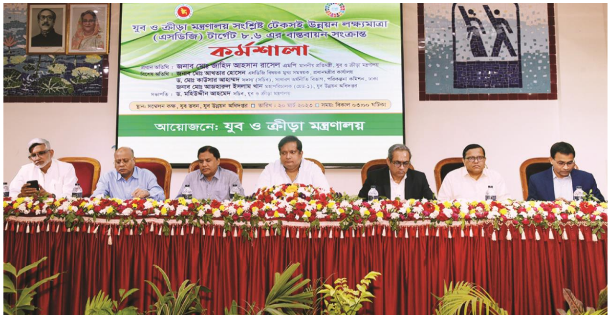
যুব ও ক্রীড়া মন্ত্রণালয় সংশ্লিষ্ট টেকসই উন্নয়ন লক্ষ্যমাত্রা SDG নির্দেশক ৮.৬ এর বাস্তবায়ন সংক্রান্ত কর্মশালায় প্রধান অতিথি মাননীয় যুব ও ক্রীড়া প্রতিমন্ত্রী জনাব মোঃ জাহিদ আহসান রাসেল এমপি ও উচ্চপদস্থ অন্যান্য কর্মকর্তাবৃন্দ