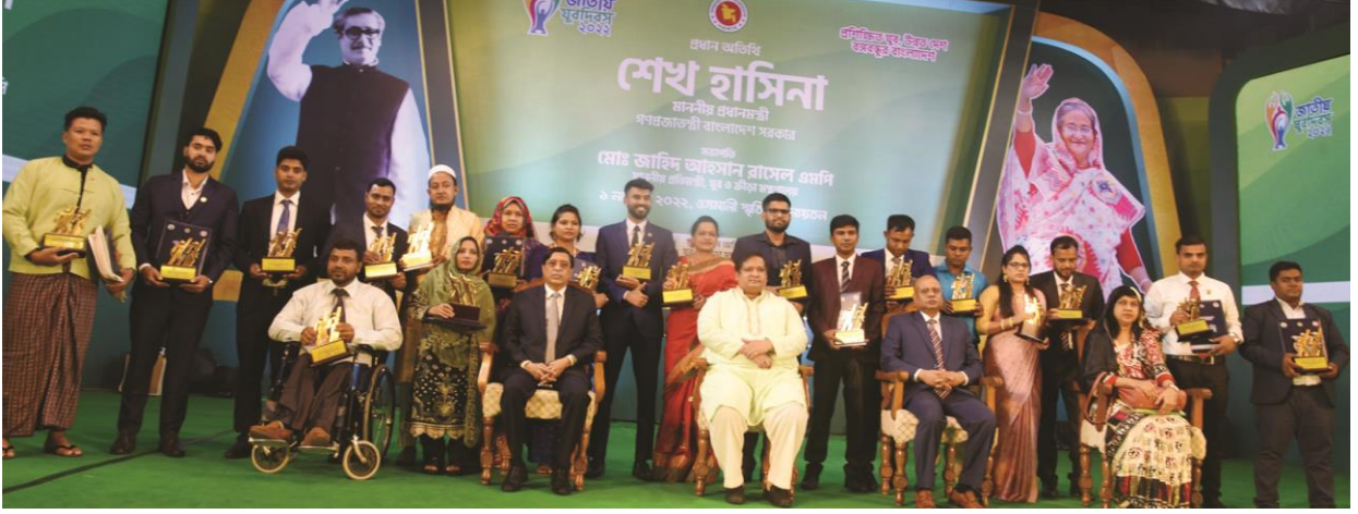
জাতীয় যুব পুরস্কার ২০২২ প্রাপ্তদের সাথে ফটোসেশন