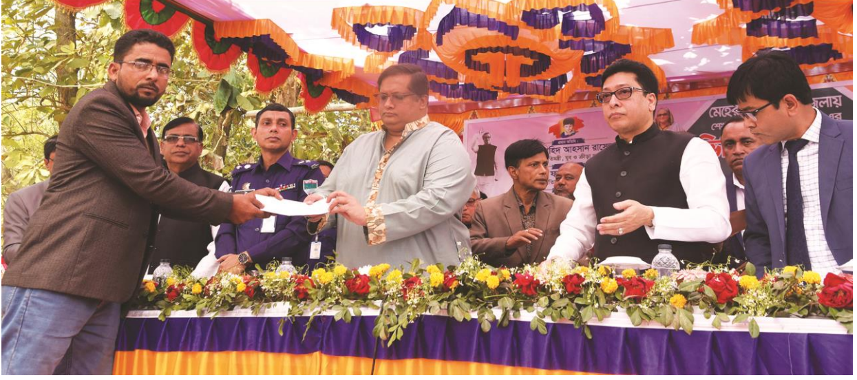
যুব উন্নয়ন অধিদপ্তর, মেহেরপুর জেলা কর্তৃক আয়োজিত অনুষ্ঠানে প্রধান অতিথি জনাব মোঃ জাহিদ আহসান রাসেল এমপি, মাননীয় প্রতিমন্ত্রী, যুব ও ক্রীড়া মন্ত্রণালয় এবং অনুষ্ঠানের সভাপতি জনাব ফরহাদ হোসেন এমপি, মাননীয় প্রতিমন্ত্রী, জনপ্রশাসন মন্ত্রণালয়।